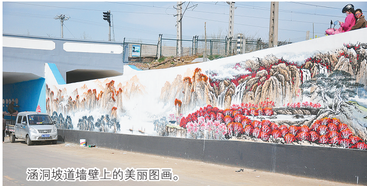
涵洞坡道墙壁上的美丽图画。

涵洞里面,两边的墙壁底色被涂成天蓝色,然后施工人员把制作好的宣传板粘贴上去。宣传