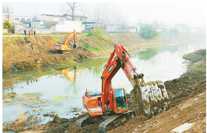
3月10日,柳河郾城区孟庙镇西营村段,两台挖掘机在河道清理淤泥、生活垃圾等杂物。当天,该村“两委”组织党员志愿者对辖区内的柳河河道进行清理整治,号召村民共同保护河流环境,共建美丽乡村。

近日,漯河市城市投资控股集团有限公司(以下简称漯河城投)2020年第一期SCP(超短期融资券,以下简称超短融)在银行间市场清算所顺利完成登记发行工作,发行规模4亿元,主体评级AA,发行期限270天,票面利率3.2%,主承销商为郑州银行,国泰君安证券为联席承销商,此次发行利率创全省同评级城投企业票面利率历史新低。 郑州银行漯河分行自成立以来,秉持服务地方、立足中小的发展理念,聚焦“商贸金融、小微金融、市民金融”三大特色业务定位,积极与漯河城投进行营销对接,了解其融资需求,为漯河城投量身打造了超短融产品,2019年5月31日获得中国银行间市场交易商协会批准注册发行8亿元的批复。2019年7月26日成功发行第一期4亿元,当时已创河南省同评级城投企业票面利率历史新低,本次为批复额度内第二次发行,再创新高。 常雷