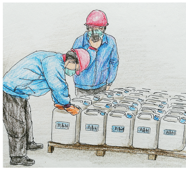
企业职工加班加点,开足马力生产消毒液。